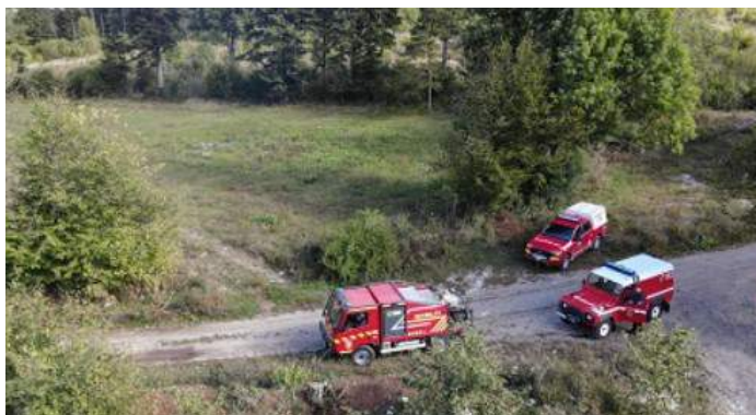
praktična vaja z vozilom GVGP-2 in dronom